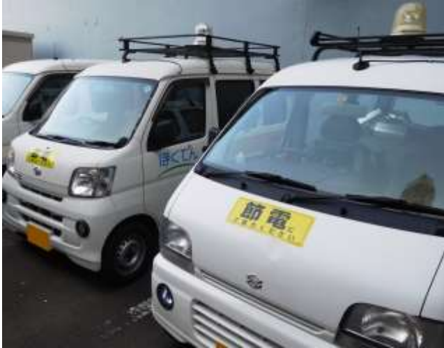
節電ステッカーを貼った社有車