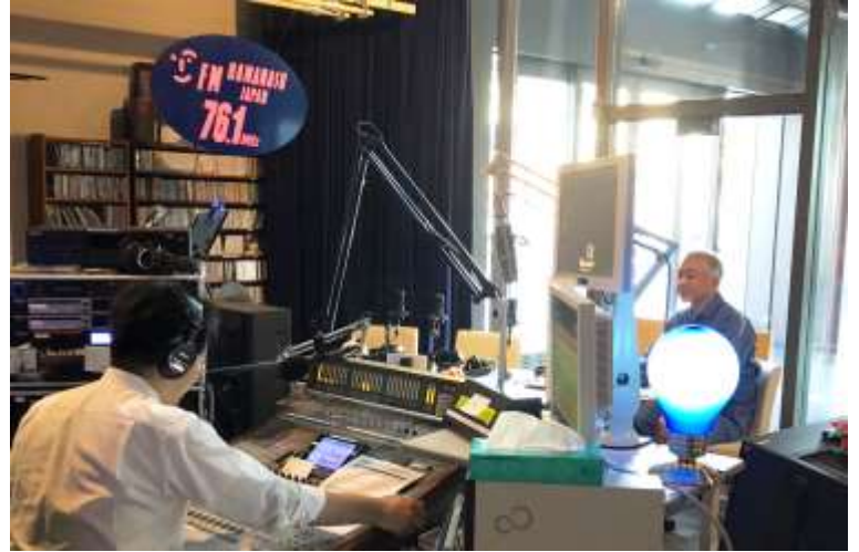
コミュニティFM放送局の番組に出演し、節電を呼びかけ